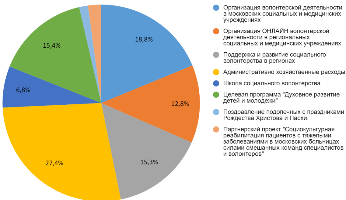
Расходы Добровольческого Движения "Даниловцы" в 2021 году